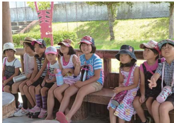
「近くの公園に散歩」