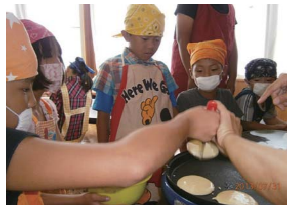
「ホットケーキ作りに挑戦!」