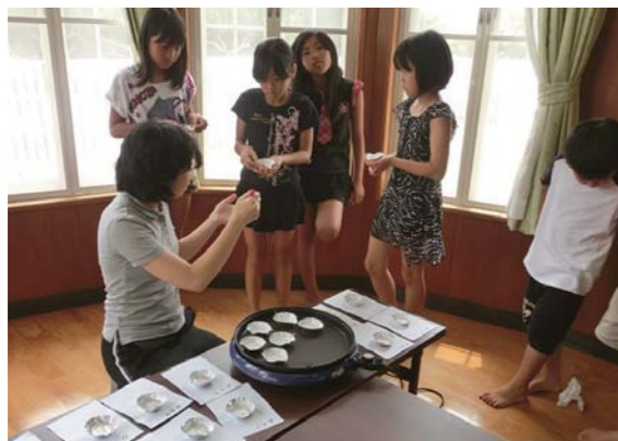
「べっこう飴も作ったよ(〇〇)」