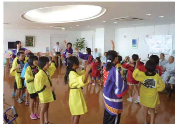
「病棟でハンヤ踊り披露」